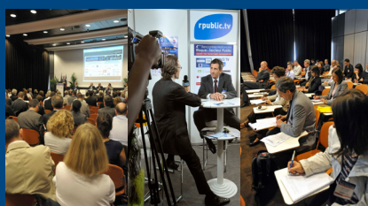
Des conférences, des interviews et des ateliers de formation animés par les partenaires spécialisés, Cabinet Stasi, March...